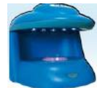
CONTADOR AUTOMÁTICO DE COLÔNIAS