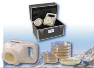
Air IDEAL 3P