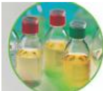
Clear Room Bottles