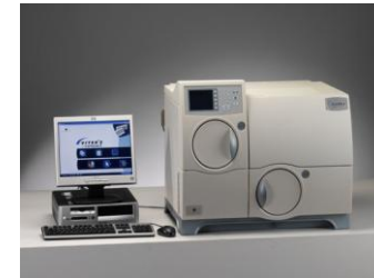
Vitek 2 ompact