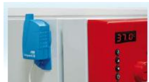
MONITORAMENTO E RASTREABILIDADE